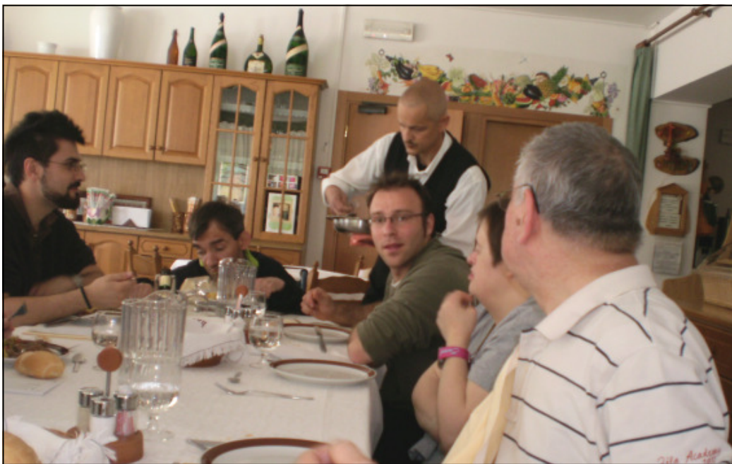
Giusto riposo al ristorante durante il soggiorno a Levico. Avremmo potuto pubblicare la foto del lago, ma i "nostri" sono più belli.