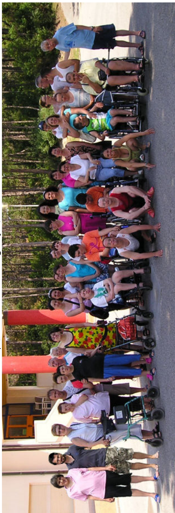
Il gruppo di partecipanti al soggiorno di lignano all'albergo “Le vele”.

Per quanto riguarda il vestiario in estate i jeans e i pantaloni lunghi lasciano il posto a pantaloncini